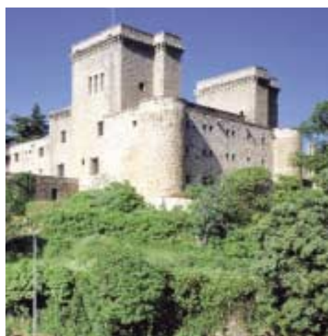
Fotografías de Paradores: fotografía superior correspondiente al Parador de Carmona (Sevilla) y fotografía inferior correspondiente al Parador de Jarandilla de la Vera (Cáceres).

del mensaje de calidad y garantías que implica el sello de la Fundación en un producto tan conocido y querido como es el Jamón Serrano y ante un público selecto y conocedor de la buena gastronomía.